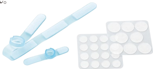
〈固形ゲルを使った新発想の固定具〉

LIPUSを使用しているため、プローブを患部に固定した状態で使えます。施術者がプローブを動かす手間を解消しました。患部への固定には、簡単に固定できる専用固定具と固形ゲルを使用。固形ゲルでは、使用後の拭き取りの必要がありません。